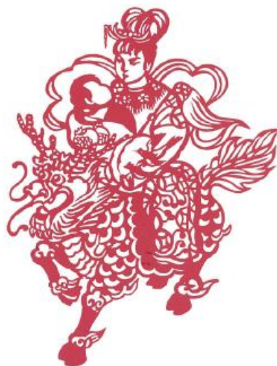
■ 關小雲大師作品：《送子娘娘》 ©關小雲