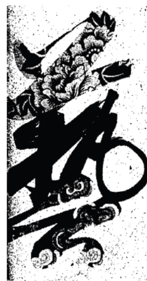
■ 首屆工藝展覽標誌

改革開放後，中港重新交流剪紙藝術。1979 年，香港旅遊業協會舉辦首屆「香港工藝展覽」，其展覽標誌的首部分便是採用剪紙圖案。1986 年 1 月，藝穗會以中國剪紙為該年藝穗節的主題，展出一幅名為《紅樓夢金陵十二釵》的剪紙作品。除了民間組織，香港政府也參與推廣中國民間剪紙。1982 年 2 月至 8 月，市政局於轄下多個公共圖書館舉辦有關剪紙藝術講座及興趣小組，更邀請被喻為「神剪」的海派剪紙大師王子淦為表演嘉賓。