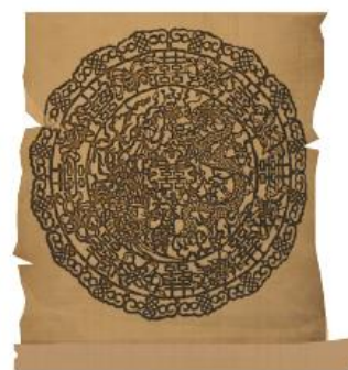
■ 北京故宮坤寧宮· 《龍鳳雙喜團花》

清代民間剪紙越趨繁榮，廣東佛山剪紙於清中葉繁盛起來，成為剪紙重鎮。右圖「龍鳳雙喜團花」是一幅收藏於北京故宮坤寧宮的清代剪紙文物，造功精美，靈活運用剪刻技法。