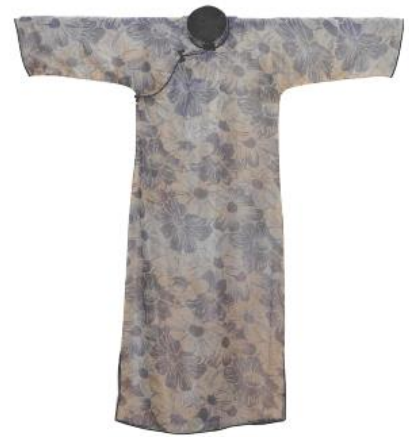
■ 1920年代的長衫

這時期的香港長衫直身修腰，大都裝有高立領，兩側有衩，下襠約與臀圍等寬，精緻滾邊以及盤扣仍然流行。