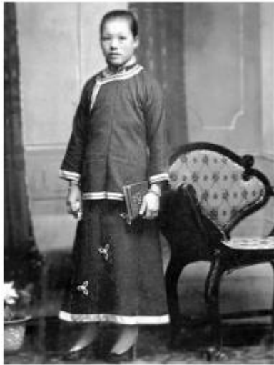
■ 上衣下裙的「文明新裝」

五四運動後，女學生穿着男性長袍參加遊行，女穿男袍隨之流行。1920 年代後期，女性化長袍已見於國內大城市，當時上海旗袍（又稱為「海派旗袍」）的發展已相當成熟，其旗袍高領窄袖、緊窄腰身、長及足踝、兩側開衩，突顯身段曲線，並融入燈籠袖、蕾絲花邊襯裙等的西方元素。