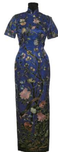
■ 1980年代後的長衫

1960 年代中期以後，西式成衣製造業蓬勃發展，加上流行文化興起，西式衣裙和牛仔褲成為少女的選擇。挑布選料再找裁縫訂製長衫變得奢侈費時，但更講究質地和做工細緻，綾羅綢緞、滾邊花紐再次備受注目。