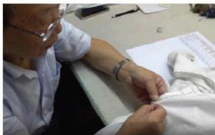
■ 海派師傅擅長針黹縫紉功夫

兩者在技術上有所不同，廣東派以車衣技術為主，以衣車縫上布料或拉鍊；海派旗袍則以師傅的針黹、縫紉功夫為主。