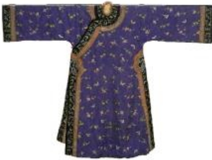
■ 晚清滿族婦女穿着的袍服和衫裙套裝

「旗袍」之名的來源眾說紛紜，尚未有確實的出處。從字面來看，「旗」指被滿清編入旗籍的人；「袍」指上下相連的服式。因此，一般人會認為旗袍是由「旗人穿的袍」演變而來。可是，清代文獻中卻找不到「旗袍」一詞。滿族人一向以袍服為主要服式，其較中原地區的袍服窄身和合體。漢族和滿族女性服裝在晚清時期已逐漸同化，因此稱「旗袍」為「旗人穿的袍」也不太準確。