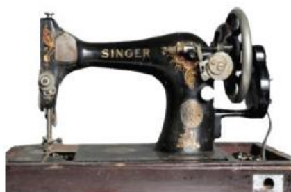
■ 廣東派師傅擅長運用衣車