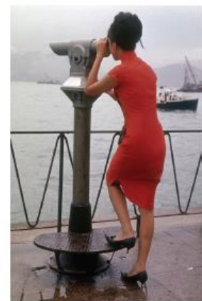
■ 1960年代香港海傍， 相中為穿著長衫的女士。

由於長衫流行，婦女會親自選料訂製，當時中環和尖沙咀平民化的疋頭店林立，售賣進口面料。這個時代穿着長衫不限階級、不限年齡，可說算是便服。